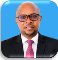
MHE. RIDHIWANI JAKAYA KIKWETE (MB.) Waziri wa Nchi, Ofisi ya Waziri Mkuu (Kazi, Vijana, Ajira na Wenye Ulemavu)