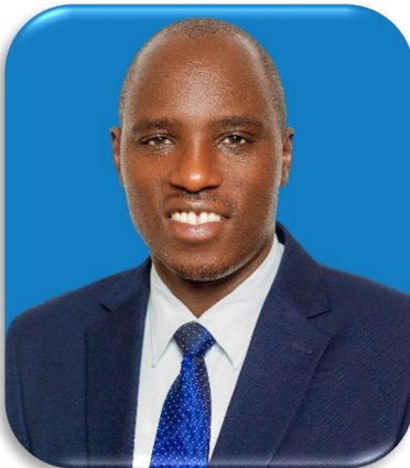
MHESHIMIWA DKT. DOTO MASHAKA BITEKO (MB.) Naibu Waziri Mkuu na Waziri wa Nishati