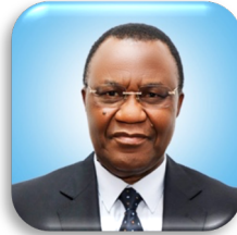
MHE. WILLIAM VANGIMEMBE LUKUVI (MB.) Waziri wa Nchi, Ofisi ya Waziri Mkuu (Sera, Bunge na Uratibu)