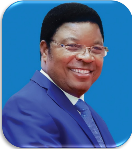
MHESHIMIWA KASSIM MAJALIWA MAJALIWA (MB.) Waziri Mkuu wa Jamhuri ya Muungano wa Tanzania