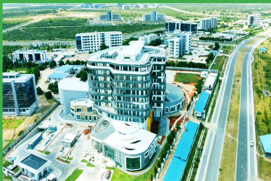
MJI WA SERIKALI MTUMBA

KIMEPIGWA CHAPA NA MPIGACHAPA MKUU WA SERIKALI, DODOMA-TANZANIA